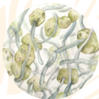
Algas verdes e hifas hongos en Soredio | 2000x

Kura Biotech a través de la Fundación Liquen refuerza su compromiso de “devolver la mano”, buscando generar esta simbiosis líquénica exitosa entre Kura y la sociedad, con el fin de lograr un impacto positivo en ella.