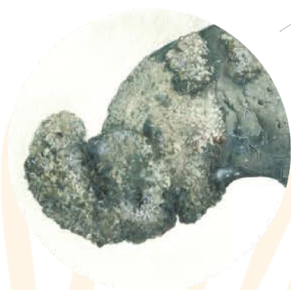
Soredio | Estructura Granancular 20x