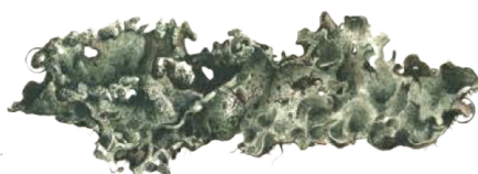
Vista General Liquen | 1x